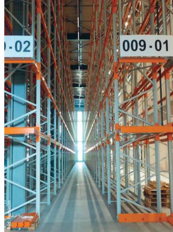
Die Fensterbänder durchfluten die Lagertrakte mit Tageslicht. Les bandeaux de fenêtres inondent de lumière naturelle les ailes de stockage.

Konsolen auf den horizontal verlaufenden Beton abgestützt.