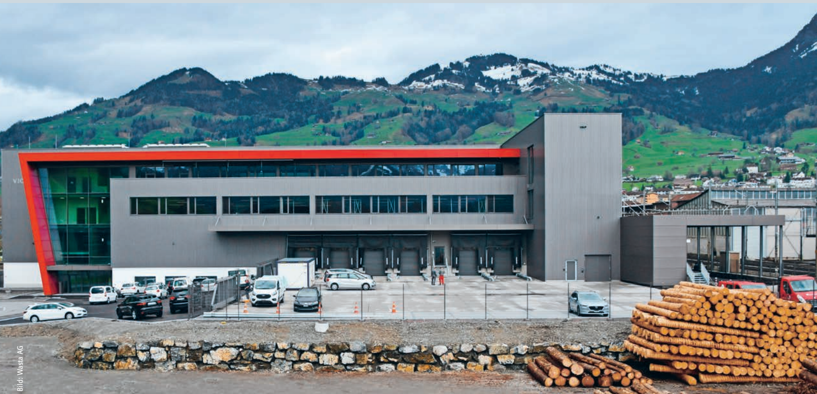
Die Südfassade des neuen Distributionscenters von Victorinox in Seewen: links die Verglasung des Haupteingangs. La façade sud du nouveau centre de distribution de Victorinox à Seewen : à gauche, le vitrage de l'entrée principale.