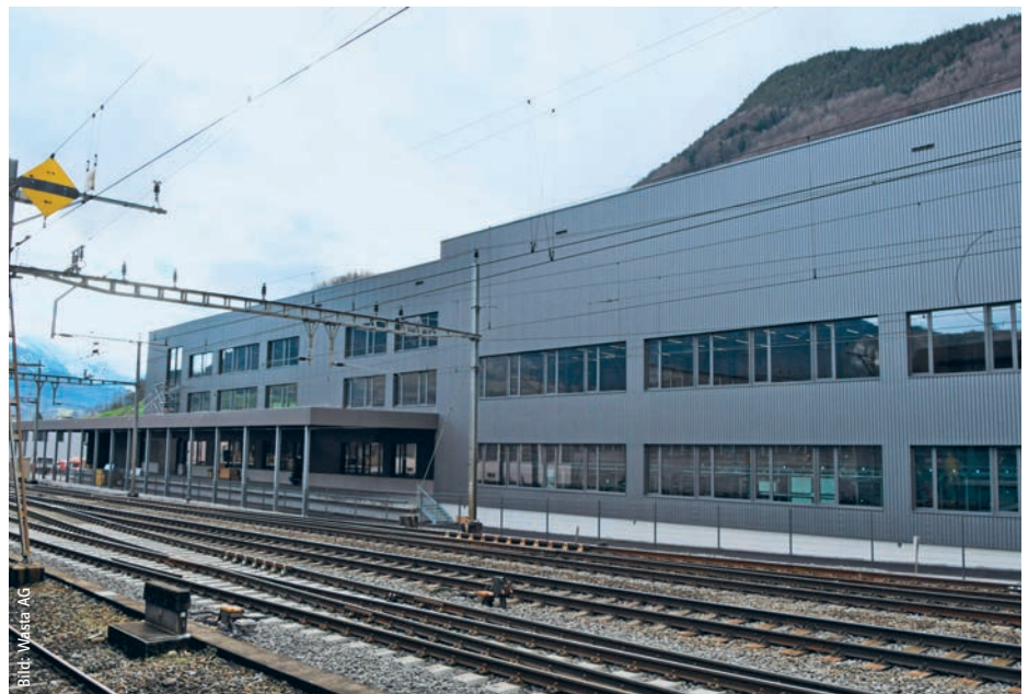
Ostfassade mit eigenem Gleisanschluss. Fensterbänder auf zwei Geschossen. Façade côté est et accès aux voies. Bandeaux de fenêtres sur deux étages.

Als Verglasungs-Aufsatzsystem kam Jansen Viss TV zur Anwendung. Die Verankerung der >