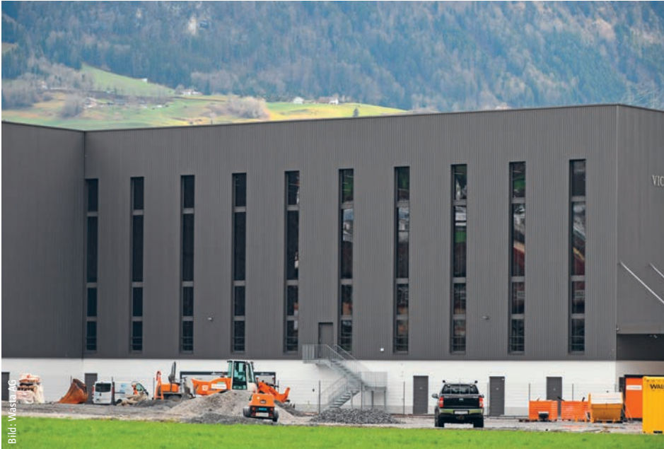
Die 12,25 m hohen Fensterbänder an der Nordfassade wurden dreiteilig hergestellt und sind mit RWA-Drehflügeln und Kippflügeln für die Nachtauskühlung ausgestattet. Les bandeaux de fenêtres de 12,25 m de haut de la façade nord sont en trois parties. Ils sont équipés de battants de désenfumage et de vantaux basculants pour le rafraîchissement nocturne.