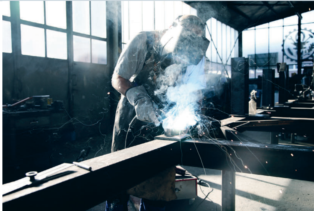
Die Schnittstelle ermöglicht Metallbaubetrieben eine ganzheitliche Lösung vom Verkauf bis zur Produktion.