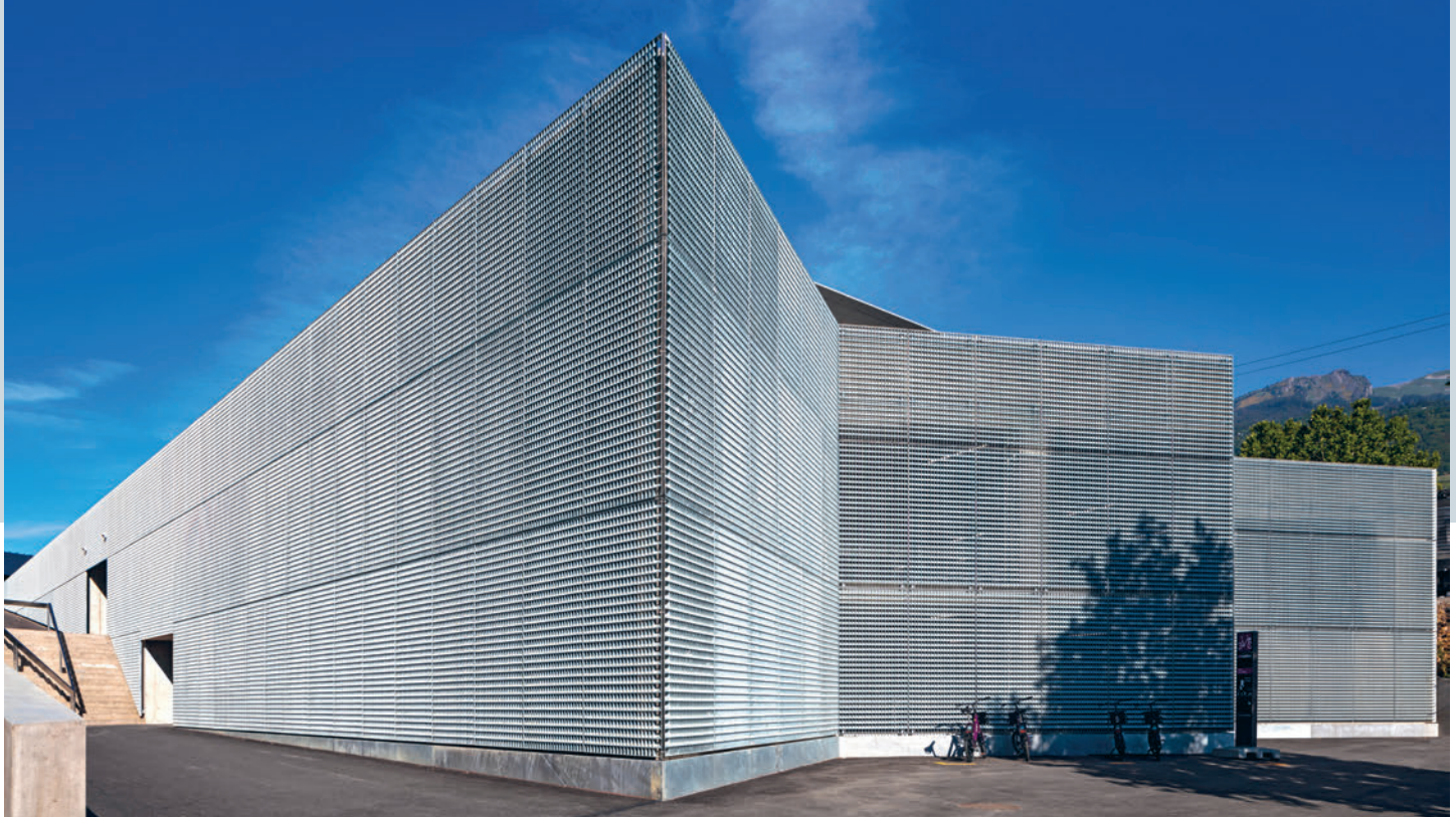
Das Parkhaus und der Busbahnhof der Handels- und Fachmittelschule Sierre sind mit Lamellenrosten von Sprich eingekleidet. Le parking couvert et la gare routière de l'École de commerce et de culture générale de Sierre sont habillés de caillebotis à lamelles de Sprich.