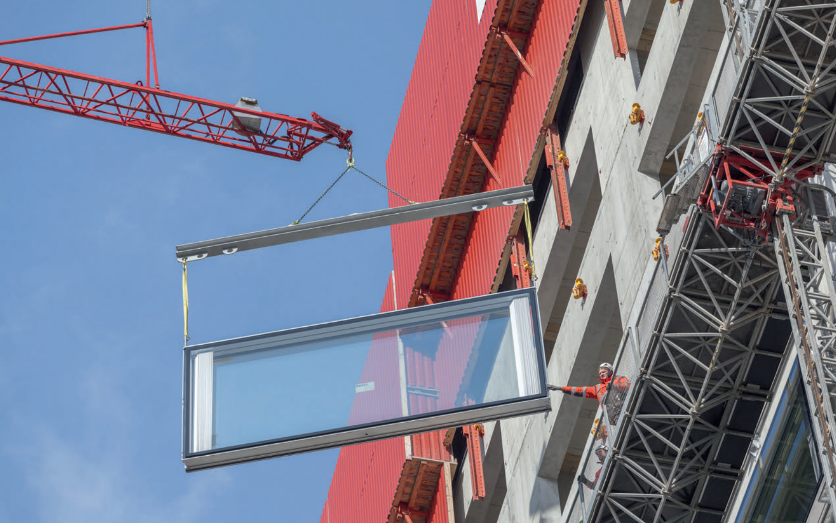
Fassaden-Elemente werden mit dem Baukran an den Zielort gehievt und ohne Gerüst montiert. Les éléments de façade sont hissés vers leur lieu de montage avec la grue de chantier et posés sans échafaudage.