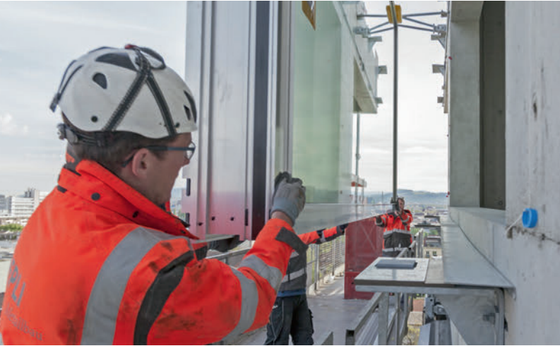
Die Auflagekonsolen mit Verstellmöglichkeiten sind vorbereitet. Die Montage des Elements geht sehr schnell.

Préparation des consoles d'appui réglables. Le montage de l'élément se fait très vite.