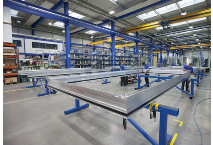
Die Elemente für das Biozentrum Basel beim Zusammenbau. Abmessungen: 5,5 x 3,4 Meter und 1,8 Tonnen Gewicht.

Préparation des consoles d'appui réglables. Le montage de l'élément se fait très vite.