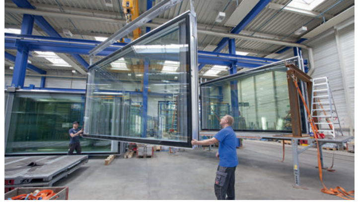
Die Elemente werden für den Transport vorbereitet. Préparation des éléments pour le transport.