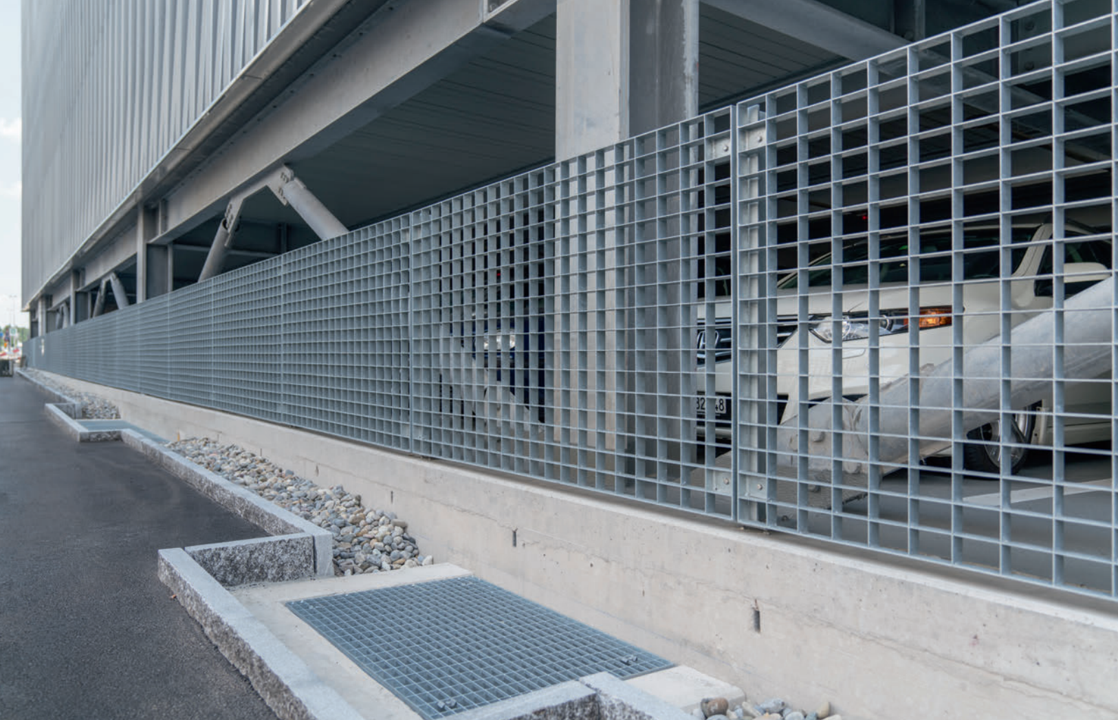
Rund 400 m 2 Gitterroste von 6,9 Tonnen kleiden Teile des Parkhauses ein.