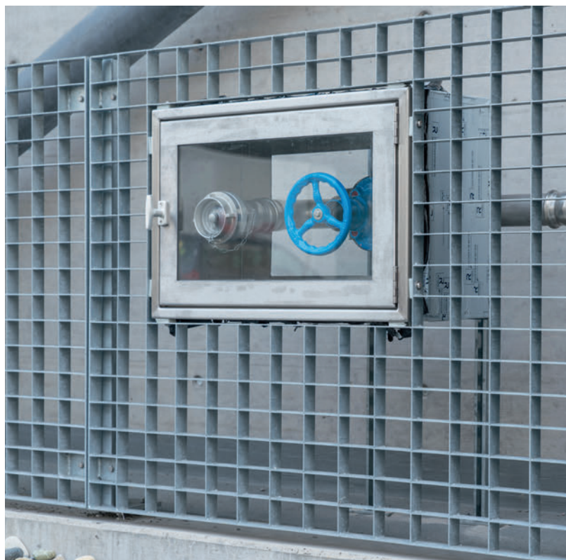
Spezielle Gegebenheiten forderten spezielle Lösungen.