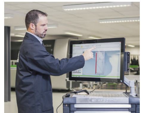
Direkte und einfache Maschinenansteuerung.