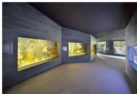
Die neuen Becken sind grösser und bieten komplexe Lebensräume.

Der glasfaserverstärkte Kunststoff, auch bekannt als Fiberglas, ist ein Verbund aus