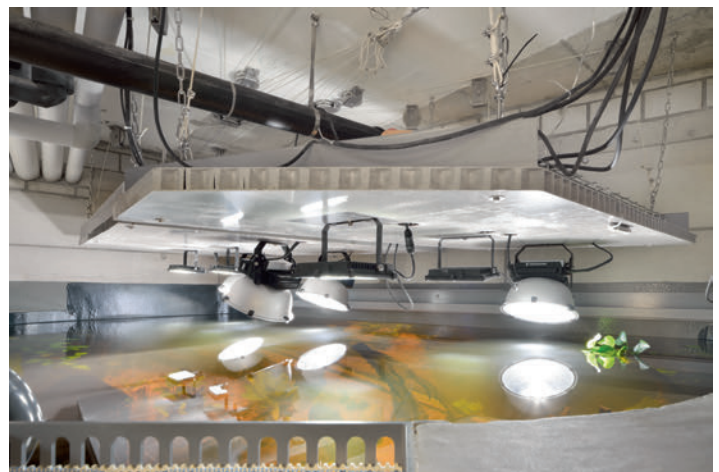
Die GFK-Roste mit den Beleuchtungen können motorisiert über verschiedene Seilzüge in der Höhe reguliert werden.