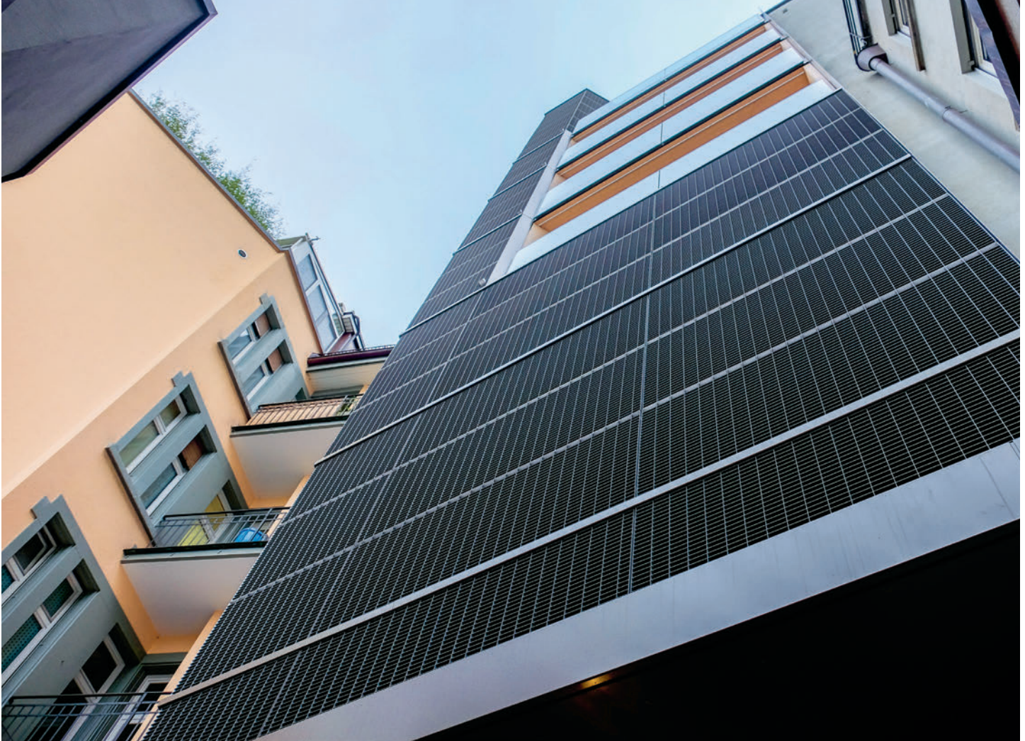
Ein gelungener Mix: Alter Bestand und moderne Konstruktionen treffen aufeinander. Un mélange réussi : l'ancien et le nouveau se rencontrent.

> Fluchten und der Fixpunkte des Gebäudes berücksichtigt werden.