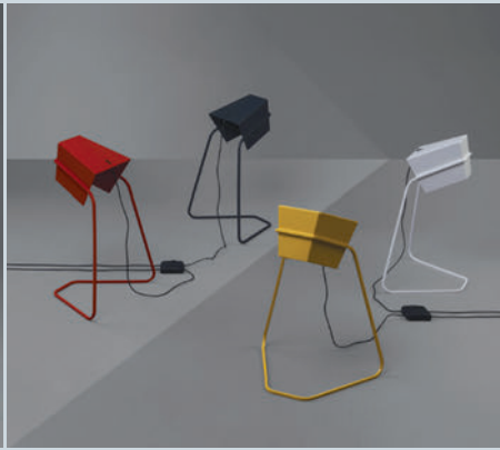
Raffinierte Beleuchtungselemente. Chaises aux diverses combinaisons de couleurs.