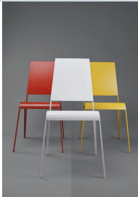
Stühle in verschiedenen Farbkombinationen. Chaises aux diverses combinaisons de couleurs.

Ich habe die beiden Designer mit dem Ziel kontaktiert, zusätzlich zu den Metallbauarbeiten wie Fassaden, Gebäudeschlosserei und Blechbearbeitung einen neuen Tätigkeitsbereich zu entwickeln. Die beiden Designer waren gleich begeistert von der Idee, eine Möbelkollektion aus Metall zu entwerfen. Sie haben schliesslich ihr eigenes Unternehmen gegründet: Kind of Design.