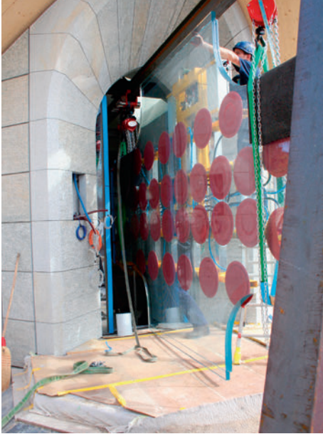
Das Glas wird horizontal durch die engen Türöffnungen in den Raum transportiert.

Le verre est transporté à la verticale à travers les étroites ouvertures de porte.