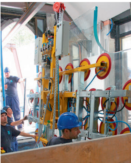
Das Glas wird hydraulisch von der vertikalen Position in die Horizontale gebracht.

Un rail équipé de deux chariots roulants a permis le transport horizontal.