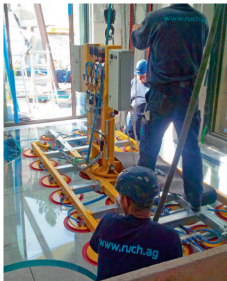
Das Glas, gehalten von der Vakumanlage, wird langsam abgesenkt.

Le verre pivoté hydrauliquement de la verticale à l'horizontale.