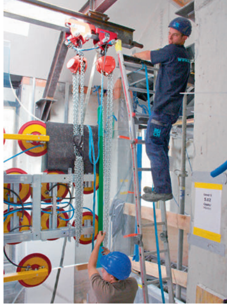
Eine Kranschiene mit Laufkatzen ermöglicht den horizontalen Transport.

Le verre est transporté à la verticale à travers les étroites ouvertures de porte.