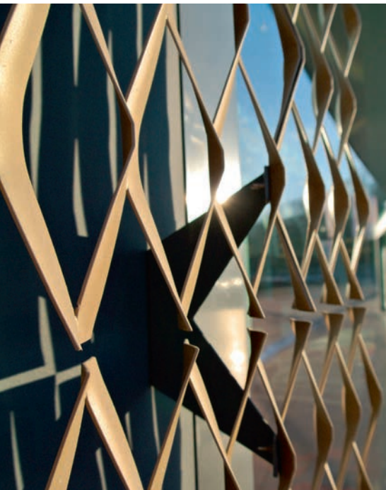
Die aus Blech geformten Montagekonsolen gewähren je zwei Befestigungspunkte. So eigneten sie sich auch für den Stossbereich der Blechelemente. Les consoles de montage en tôle offrent deux points de fixation chacune et convenaient donc aux zones de jonction des éléments en tôle.