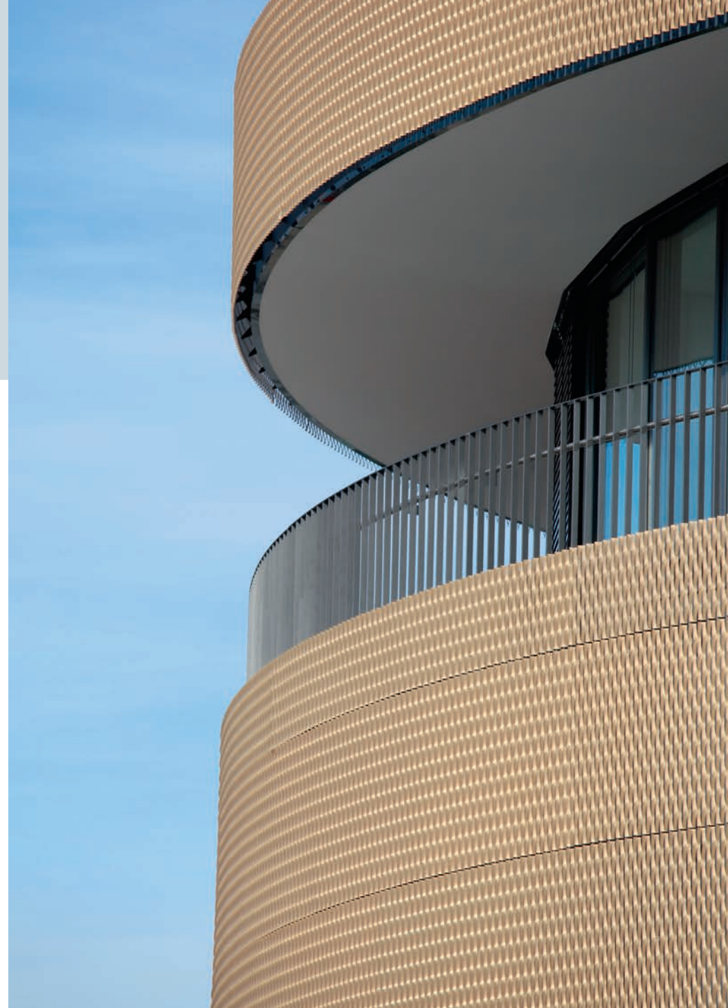
Die Streckmetalle liessen sich ohne vorwalzen in den entsprechenden Radius formen. Inutile de laminier les métaux déployés à l'avance pour leur donner la forme arrondie voulue.

deux petites fixations sur l'extérieur et sont ainsi quasiment indétectables. Ces deux points de fixation indépendants ont permis de fixer les panneaux normalement, mais ils ont aussi trouvé une utilité dans les zones de jonction. Là, un panneau est riveté au point de fixation supérieur, l'autre au point de fixation inférieur. Avec un seul type de console, un dimensionnement précis correspondant aux formats des panneaux en métal déployé et le montage préalable de toutes les consoles, le montage de l'ensemble