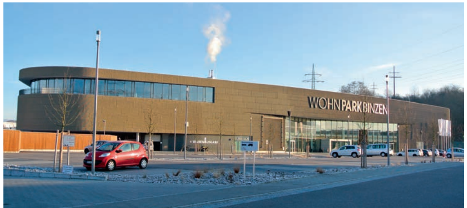
Eine homogene Streckmetall-Fassade zieht sich um das Möbelhaus mit seinen ovalen Gebäudeenden. Une façade en métal déployé homogène s'étend sur le magasin d'ameublement dont une extrémité est de form ovoïdale.

Die Streckmetall-Tafeln sind punktuell an vorgängig eingemessene und montierte Blechkonsolen befestigt. Die einzelnen Blechkonsolen sind Z-förmig abgebogen, so dass der eine Lappen parallel auf der Kaltfassade aufliegt und der andere Lappen, ebenfalls parallel mit der Neigung des Streckmetalls übereinstimmt. Dadurch dass die Konsolen in der Mitte ausgeklinkt sind, weisen sie auf der Aussenseite nur je zwei kleine Befestigungsauflagen auf. >