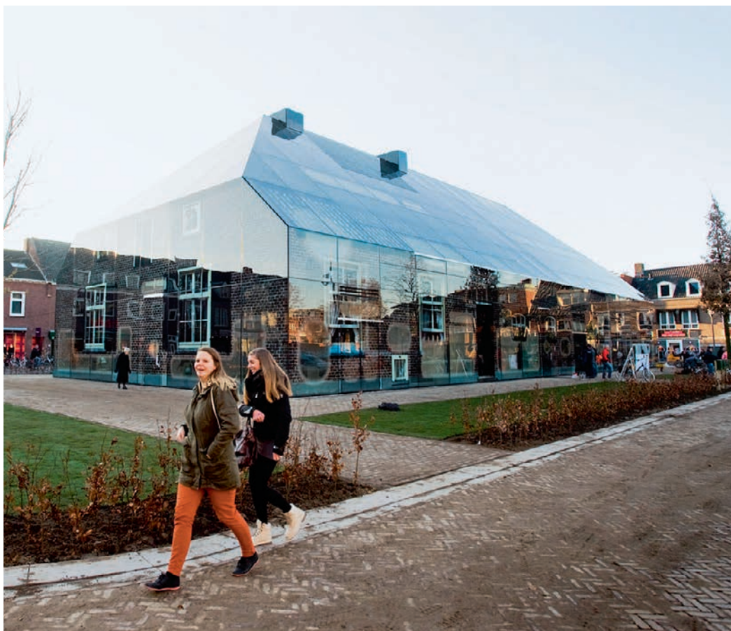
Das vollständig verglaste Gebäude, beherbergt Restaurants, Läden und ein Fitnesscenter. Le bâtiment entièrement vitré abrite des restaurants, des magasins et un centre de fitness.

Zufälligerweise hatte der maximale Gebäudeumriss, der von den Stadtplanern festgelegt worden war, die Form eines traditionellen örtlichen Bauernhauses. MVRDV liessen sämtliche noch vorhandenen Gehöfte im Umkreis ausmessen und analysieren und ermittelten einen «idealen» Durchschnitt aus den Daten. In Zusammenarbeit mit den Planern fotografierte der Künstler Frank van der Salm alle traditionellen