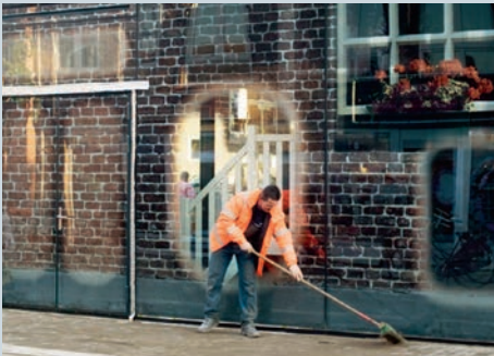
Raffinierte Täuschung mit vermeintlichem Blick ins Innere.

Illusion raffinée qui simule un aperçu de l'intérieur.