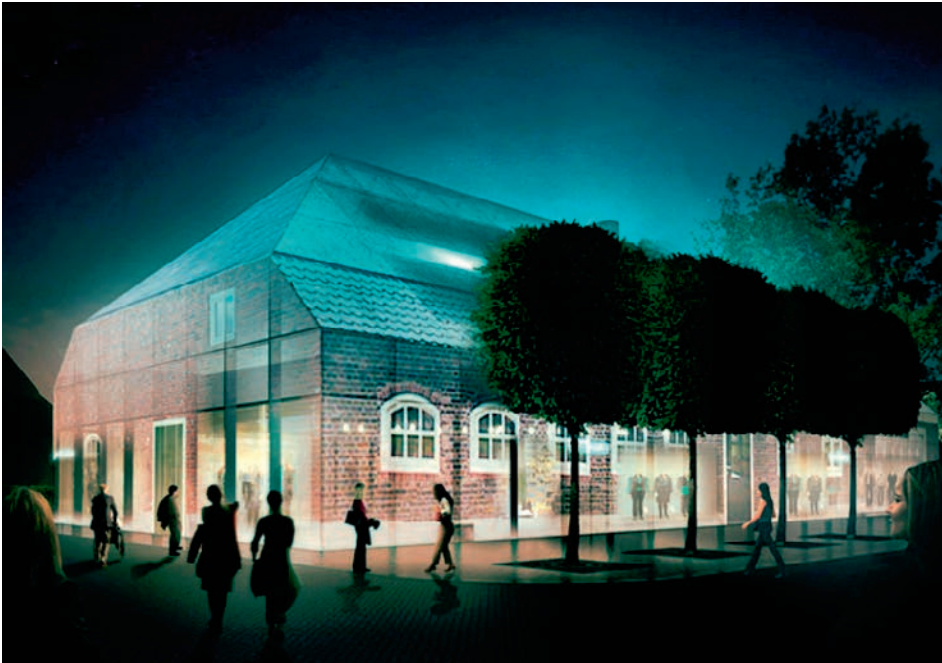
Beeindruckende Wirkung auch in der Nacht.

Certaines parties ont une vue sur l'extérieur.