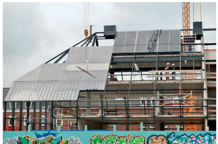
Einbringen der ersten Glaselemente und Lüftungspaneelen. Réception des premiers vitrages et panneaux d'aération.

> von 14 Metern ist die Glass Farm mit Absicht überdimensioniert, etwa 1,6-mal grösser als ein echtes Bauernhaus, was symbolisch das Wachstum vom Dorf zur Stadt verkörpern soll. Die aufgedruckten Bilder folgen ebenfalls dieser Symbolik, das aufgedruckte Scheunentor ist beispielsweise vier Meter hoch. Wenn Erwachsene das Gebäude betrachten, so tun sie dies aus der Perspektive eines Kleinkindes, was möglicherweise ein nostalgisches Gefühl auslöst. Um diesen Effekt noch zu verstärken, befindet sich neben dem Gebäude ein Tisch und eine Schaukel, eine Art überdimensionaler Bauernhausgarten.