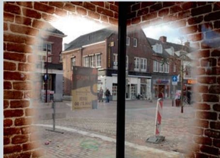
Einzelne Bereiche gewähren den freien Blick nach aussen.

Illusion raffinée qui simule un aperçu de l'intérieur.