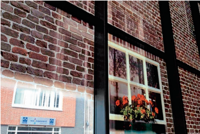
Einzigartige Detailarbeit. Détails singuliers.