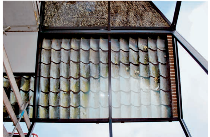
Imposante Details Détails impressionnants.