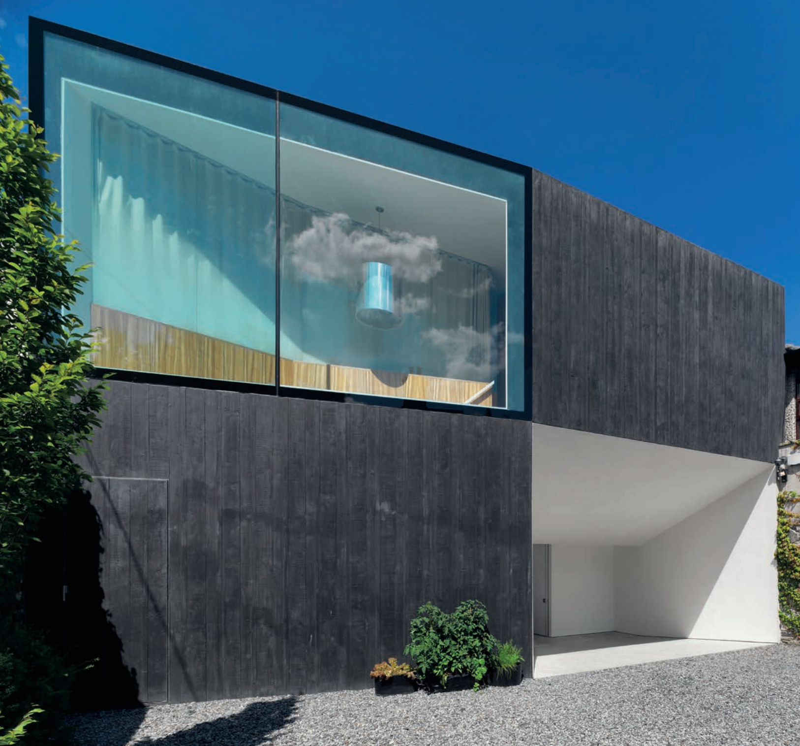
Die schwarze Betonfassade im Farbton einer Schultafel. La façade de béton, de teinte ardoise.

des plus grands architectes de l'île. Dans de nombreux cas, ces objets sont devenus aussi convoités que les maisons de maître auxquelles ils