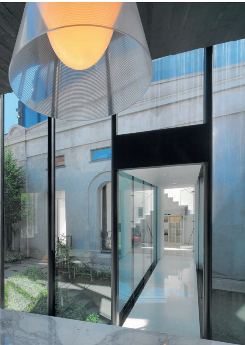
Blick in den Verbindungsgang. Eine SSG-Verglasung kreuzt sich mit einer Pfosten-Riegel-Konstruktion.

Vue depuis le couloir de jonction : un vitrage SSG associé à une construction poteaux-traverses.