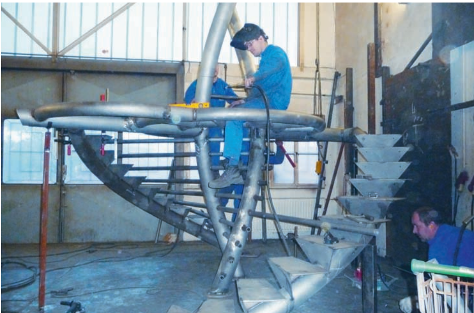
Eine besondere Herausforderung war die hohe Massgenauigkeit der gesamten Konstruktion mit den Anbauteilen.

Eine weitere Aufgabe, der sich der Treppenbauer stellte, war die gute Transportfähigkeit und Montagefreundlichkeit der Treppenanlage für die Europatournee. Um die Passgenauigkeit aller Teile überprüfen zu können, musste trotz engen Zeitkorridors die Konstruktion vor dem Transport nach Lissabon komplett in der Werkhalle des Treppenbauers aufgebaut werden. Die DNA-Form dieser Treppe lässt sich auch als Vorbild bei der Gestaltung von anderen Spindeltreppen anwenden. Spindelrohr und Rohrhandlauf fügen sich hier gegeneinander spiralförmig zu einem DNA-Strang zusammen. ■