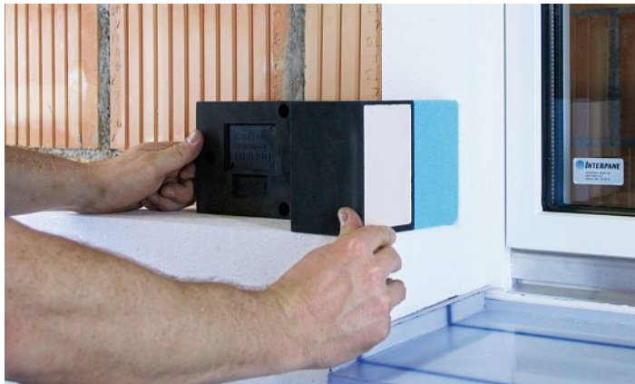
Dosteba-Lösung: Ohne metallische Durchdringung, thermisch getrennt, in jeder Dämmstärke erhältlich.

Bedingt durch unsachgemässe Ausführungen, durch vorgegebene Konstruktionen und durch Materialwahl können Wärmebrücken auftreten. Diese Ursachen treten oft gleichzeitig auf und verstärken sich deshalb in ihrer Wirkung. Dosteba AG befasst sich seit Jahren mit wärmebrückenfreien Elementen, welche konstruktions- und materialbedingte