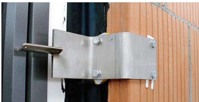
Metallvariante: Wärmetechnisch ineffizient, zeit- und kostenaufwendig.

Wärmebrücken sowie Kombinationen aus ihnen vermeiden.