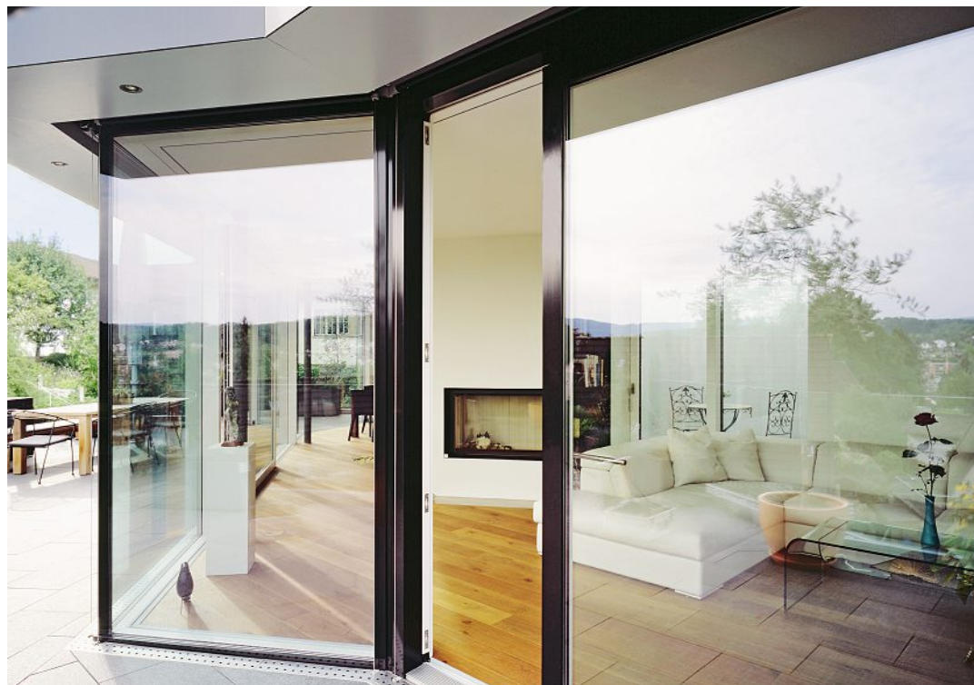
Wetterbeständiges Aluminium und hervorragende Dämmwerte zeichnen die Schiebetür STI aus.

Glasschiebetüren bieten grosszügige Glasflächen und freie Sicht nach aussen. Die neue isolierte Schiebetür STI von Schweizer überzeugt nicht nur durch ihr hochwertiges Design und ihre herausragenden Dämmeigenschaften. Übergrosse Dimensionen, schlanke Profile in Aluminium und bodenbündig ausgeführte Festverglasung sind ebenfalls ihre Markenzeichen. Die leichtgängigen Schiebebeschläge funktionieren ohne Hebemechanismus, der Übergang ist schwellenlos und hindernisfrei. Eine einbruchssichere Spaltlüftung hält darüber hinaus die aufmerksamen Diebe fern. Die obere Dichtung wird mit dem Türgriff abgesenkt, ohne die untere Dichtung anzuheben. Die frische Luft kann somit bei Abwesenheit gut dosiert