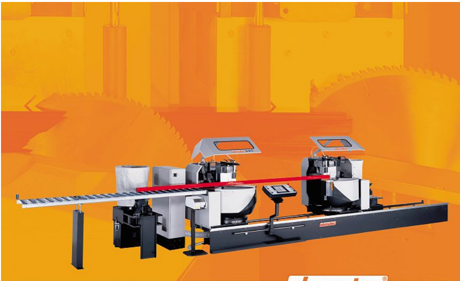
elumatec ® DG 244

Die Doppelgehrungssäge DG 244 für das effiziente Sägen von Aluminiumprofilen.