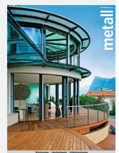
Titelbild: Hans Ege, Luzern Photo de couverture: Hans Ege, Lucerne