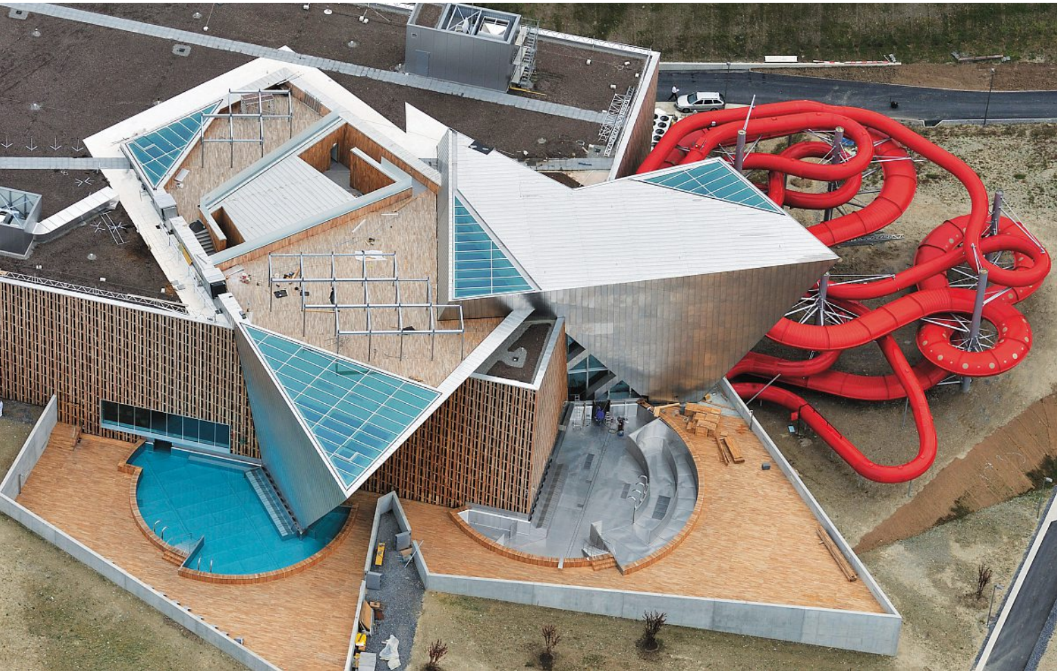
Sicht von oben auf den Gebäudekomplex mit seinen Kristallen. Le complexe de bâtiments vu de dessus avec ses cristaux.