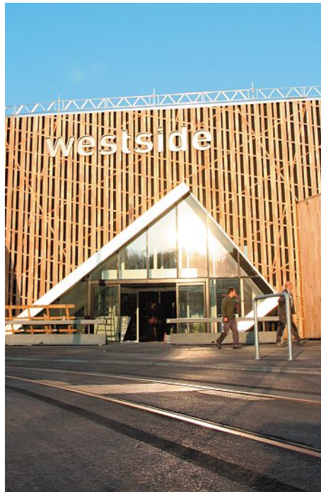
Bereits der Eingangsbereich symbolisiert die Vorliebe von Daniel Libeskind für schräge Formen. La zone d'entrée symbolise déjà la prédilection de Daniel Libeskind pour les formes obliques.

Mit seiner beeindruckenden Lage über der Autobahn A1 und seiner direkten Anbindung an die S-Bahn und das Transportnetzwerk BERN-