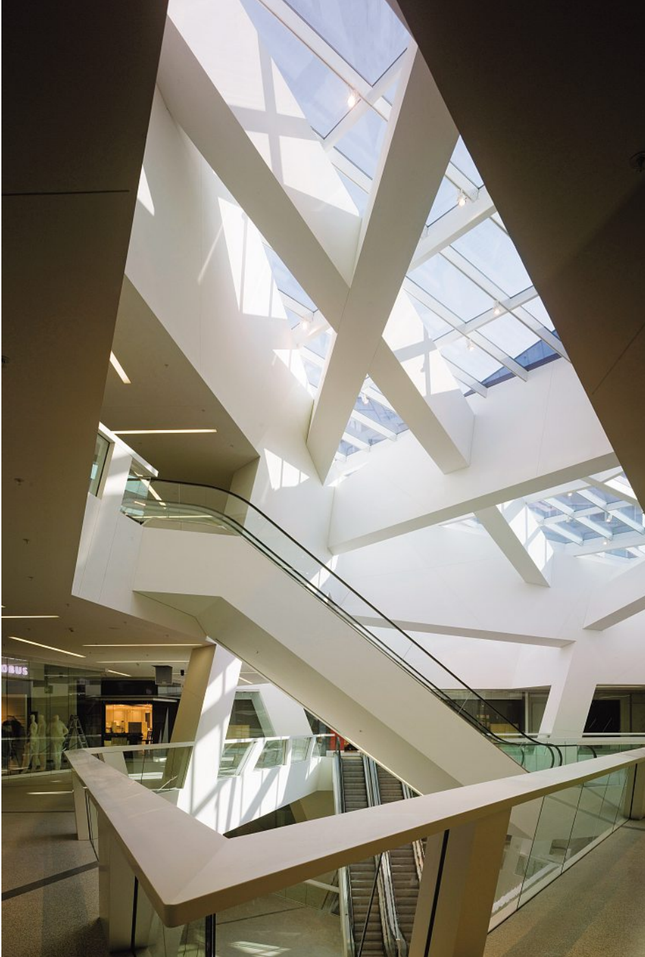
Die gitterförmige Profilierung des Kristalls (Oberlicht) generiert ein imposantes Schattenspiel. Le profilage treillissé du cristal (lucarne) crée un jeu d'ombres imposant sur les murs blancs.